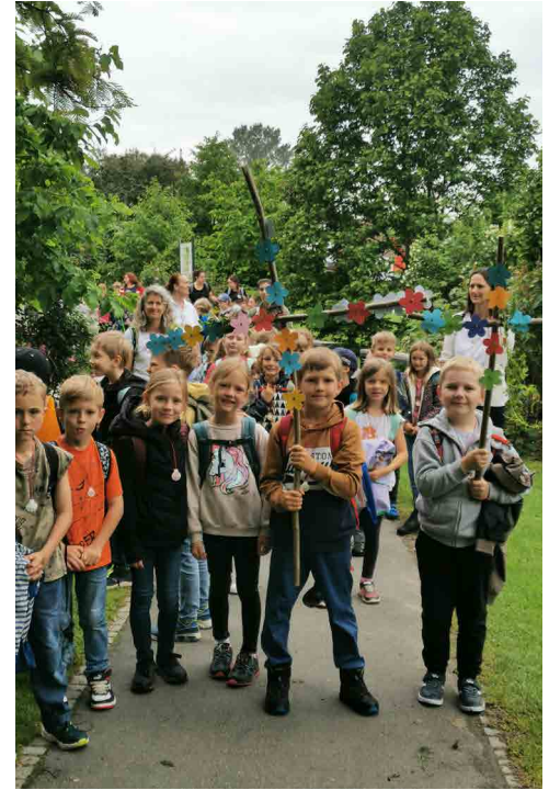
VS Fernitz: In diesem Jahr machten alle Kinder und Lehrer zusammen eine Wallfahrt. Wir gingen betend und singend ein Stück auf dem südsteirischen Jakobsweg, und nach Lob-, Dank- und Bibelstationen feierten wir in unserer Pfarrkirche weiter.

Wir freuen uns auch weiterhin auf viele gemeinsamen Aktionen und Feiern und die gute und segensreiche Zusammenarbeit untereinander und mit der Pfarre, für die uns anvertrauten Kinder und unsere christliche Gemeinschaft in der Pfarre.