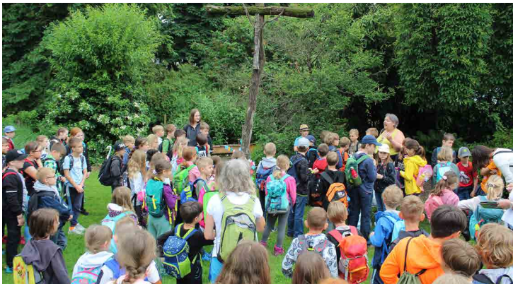
VS Mellach: Unsere Schule begab sich im Frühling auf Wallfahrt zur Jakobikirche und startete eine Spendenaktion für das Projekt unseres Herrn Pfarrer für Tansania.