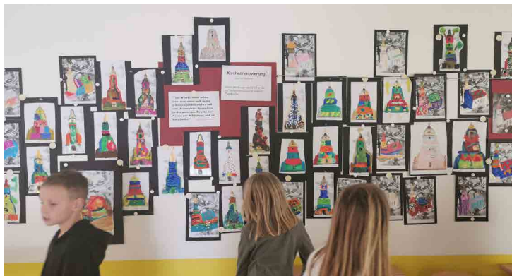
Gestaltung der Bilder und Minimagnete zum Thema Kirchenrenovierung. Diese konnten beim Pfarrfest bestaunt werden.